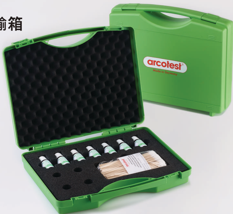
运输箱，小型 适用于 7 个 10ml 的测试墨水瓶 用于棉签的存放盒