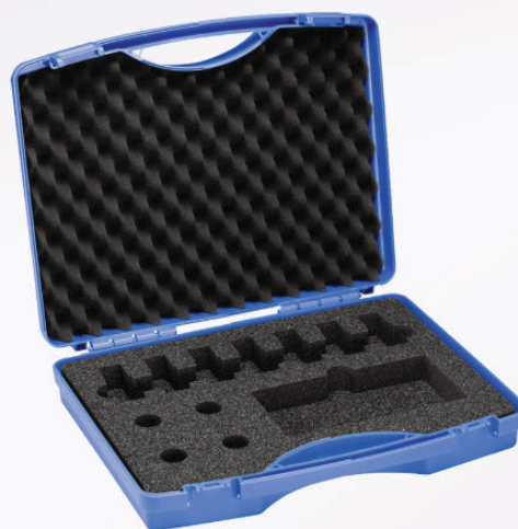
运输箱，小型 适用于 7 个 10 ml 测试墨水瓶 用于测试笔或棉签的存放盒