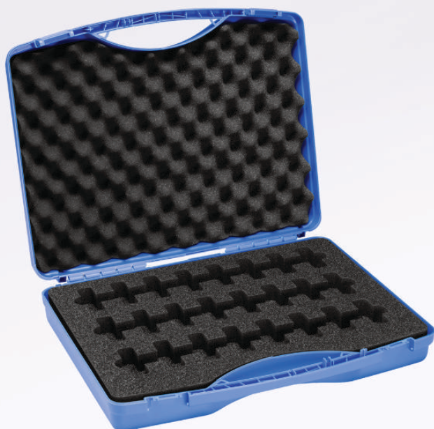
运输箱，大型 适用于 24 个 10 ml 测试 墨水瓶