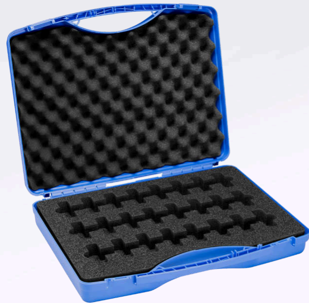
Valigetta da trasporto, grande Per 24 inchiostri di prova da 10 ml.