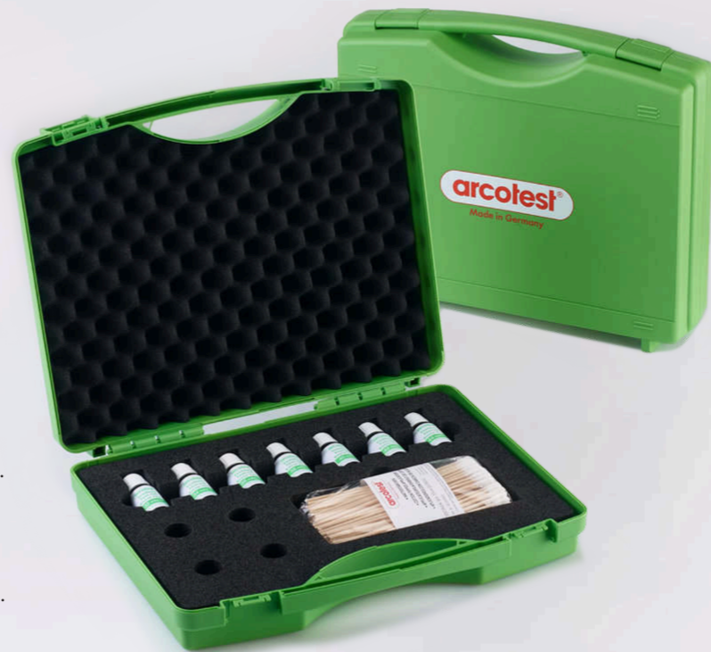
Valigetta da trasporto ORGANIC, piccola Per 7 inchiostri di prova da 10 ml. Vano per le penne di prova o i bastoncini cotonati.