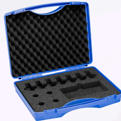
Valigetta da trasporto, piccola Per 7 inchiostri di prova da 10 ml Vano per le penne di prova o i bastoncini cotonati.